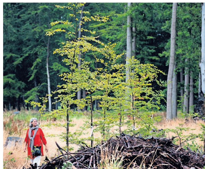
▲ Op landgoed Zuylestein is een begin gemaakt met nieuwe aanplant.