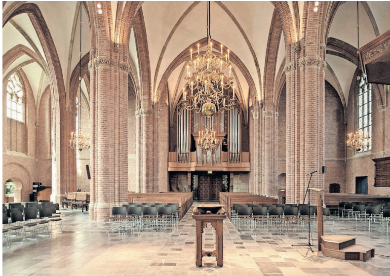
▲ De Cunerakerk in Rhenen is de locatie voor het English Music Festival.